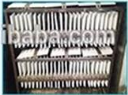
4. Second paint and bake