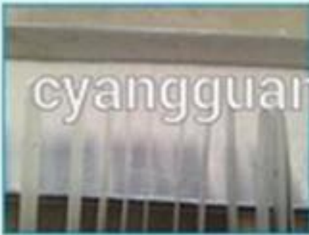
3. Paint and bake