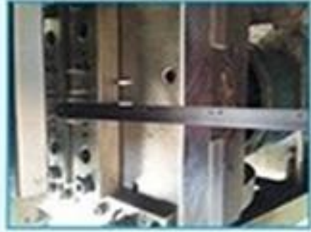
2. Hit the hole