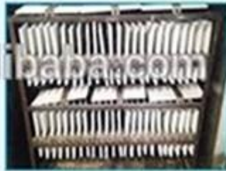
4. Second paint and bake