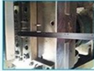
2. Hit the hole