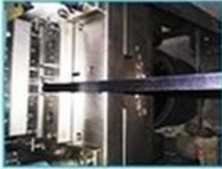
1. Cut the size as customized