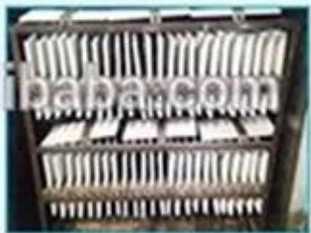
4. Second paint and bake