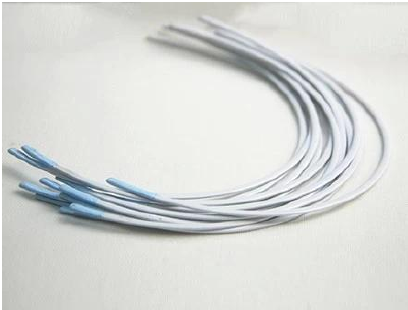
Filo di memoria in lega di titanio.