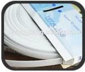
1 Inner Package