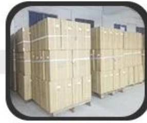
3 Carton Package