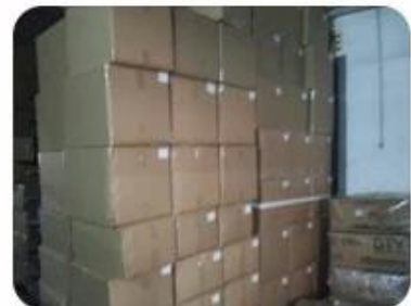
6. Finished Product