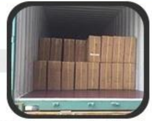
4 Delivery and Shipping