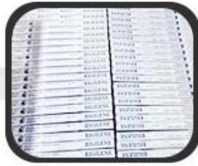
2 Box Package